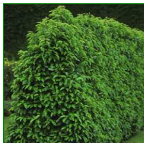
Laurier du Portugal